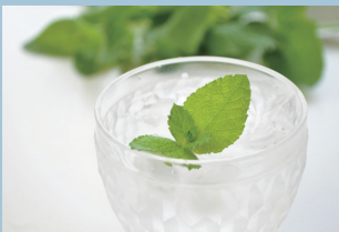
おいしい水をたっぷり