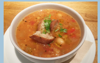
おいしい料理の基本