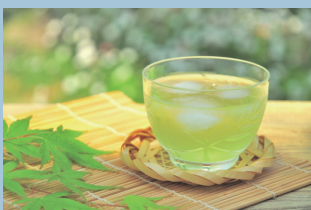
水がおいしいとお茶もおいしい