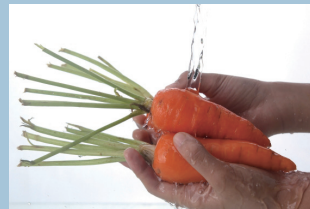
野菜洗いも浄水で