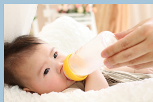
ミルクの水にはこだわりたい