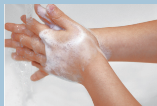
健やかな肌をまもる